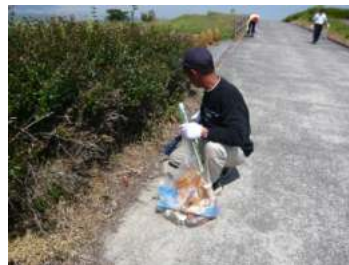
公園の空き缶・ゴミ拾い