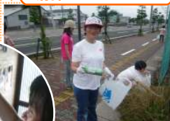
清掃ボランティア