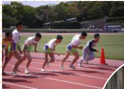
スポーツ 行事参加

地域の中で障がいのある人たちが仲間と協力しながらいきいきと活動するために、自分たちで組織・運営する団体です。ボランティアやクラブ活動、地域の行事参加など交流・貢献の場を広げ自らの声を行政へも訴えています。