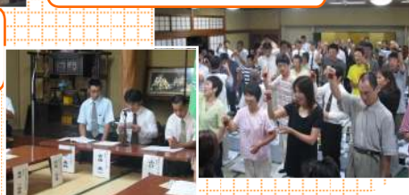
総会・懇親会の開催